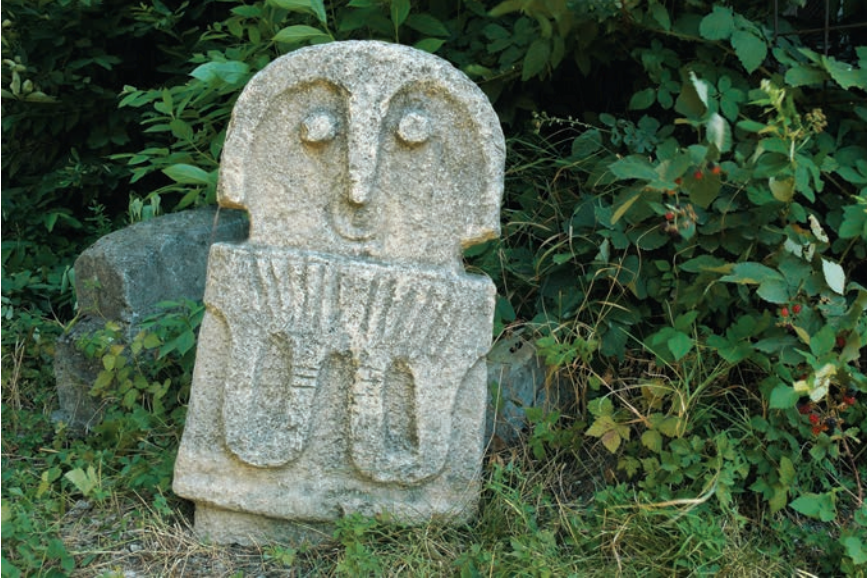
Рис. 1 Антропоморфное изваяние, вид спереди, 8–6-е века до н. э., из окрестностей Мартакерта (Государственный историко-краеведческий музей Арцаха)

Культура стел Арцаха становится наиболее ярко выраженной, начиная с первого тысячелетия до н. э. и предстает в виде антропоморфных каменных изваяний (рис. 1–4). Каменные антропоморфные изваяния Арцаха – одни из важнейших составляющих дохристианской культуры.