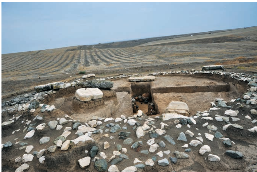
Рис. 7 Аэрофотоснимок гробницы Нор Кармиравана

ская упряжь, особый погребальный обряд, некоторые культурные особенности, в том числе появление антропоморфных стел. Сведения письменных источников, полностью соответствующим археологическому материалу, позволяют предположить, что из этих племен особое место занимают получившие в научной литературе название «киммерийско-скифские» племена.