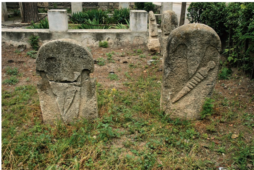
Рис. 4 Антропоморфные изваяния, вид сзади, 8–6-е века до н.э., Бахшун Тапа (Мартакертский историко-краеведческий музей)

Все точки обнаружения изваяний приходятся на долину нижнего течения реки Хаченагет (там, где река вытекает в степь) или ее окрестности. Эти территории очень плодородны как для занятий скотоводством, так и для земледелия. Кажется, что эта лугово-степная зона, через которую протекает одна из самых крупных рек региона, должна была привлекать тех, кто стоял у истоков этой культуры.