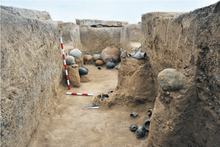
Рис. 6 Нор Кармираван, раскопки гробницы, 8 – 6-е века до н. э.

отметить, что проблема усложняется тем, что большинство изваяний были найдены не на первоначальных местах (in situ) их возведения. Только одна группа из более чем 30-ти изваяний была зафиксирована в своей естественной среде. Произведенные в 2016-ом году в селе Нор Кармираван Мартакертского района археологические раскопки показали, что большая часть обнаруженных изваяний находится на своем первоначальном месте – месте погребения. Материал, выявленный из погребения, датируется 8–6-ым веками до н. э., что является наиболее вероятной датировкой стел (рис. 6–7).