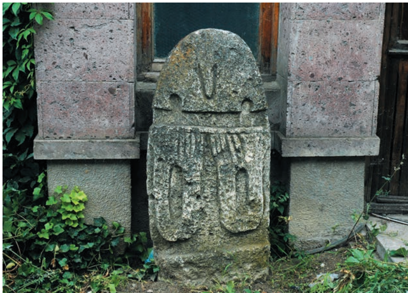
Рис. 2 Антропоморфное изваяние, вид спереди, 8–6-е века до н. э., около Степанакерта

Отсутствие волос, ушей, рта и иногда глаз, изображение косо подвешенных кинжалов на спине в области поясницы, делают вероятным наличие одежды и других составляющих наряда, которые попросту не считались важными и не были запечатлены. Это важный аргумент, позволяющий предполагать, что мы имеем дело с символической иконографией: изображался не реальный внешний вид, а его символично-смысловые составляющие. Мы можем сделать вывод, что изваяния изображают мужчин, в основном в военном снаряжении 4 .