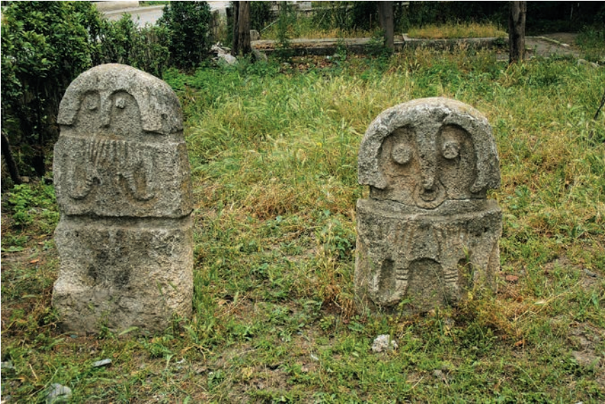
Рис. 3 Антропоморфные изваяния, вид спереди, 8–6-е века до н.э., Бахшун Тапа (Мартакертский историко-краеведческий музей)

Эти территории в советские годы по понятным причинам особо не изучались, а произведенные исследования были явно политизированы. Это относится также к антропоморфным изваяниям, которые азербайджанские ученые представляли как албанские, пытаясь связать их распространение (особенно в Арцахе) с присутствием албанского этнокультурного субстрата. Поэтому исследование этих памятников, определение их точной датировки и этнокультурной принадлежности представляет не только научный интерес, но и дает возможность противостоять азербайджанской фальсификации.